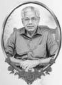
കെ.ഒ. സേവ്യർ കോയ്മക്കാട്