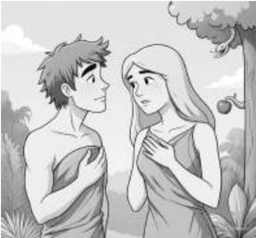
എത്തിത്തൊടാൻ എത്തുകില്ല വാരിയെല്ലാണു നീ