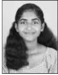
അമ്പിയ സാമുവൽ പള്ളിപ്പറമ്പിൽ