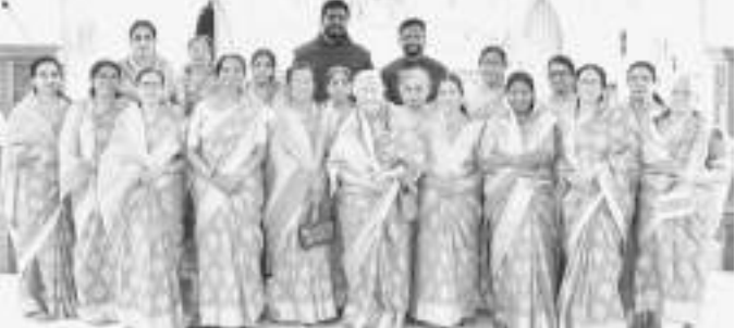
ലിജിയൻ ഓഫ് മേരിയിലെ അംഗങ്ങൾ വികാരി അച്ചനോടും കൊച്ചുനോട്ടുമൊപ്പം

14.09.2025 ഞായറാഴ്ച ലിജിയൻ ഓഫ് മേരിയിലെ അംഗങ്ങൾ വാർഷിക ദിനം ആഘോഷിച്ചു. അന്നേ ദിനം രാവിലെ 9 മണിയുടെ ദിവ്യബലിക്ക് നേതൃത്വം നൽകുകയുണ്ടായി.