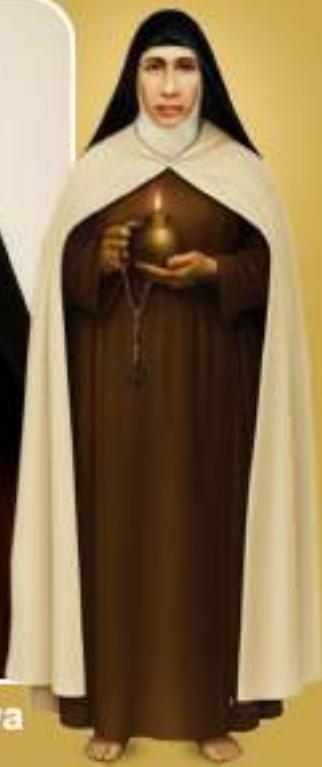
Blessed Mother Elishwa