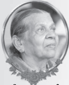
ട്രീസ സേവ്യർ ആഞ്ഞിലിക്കാട്