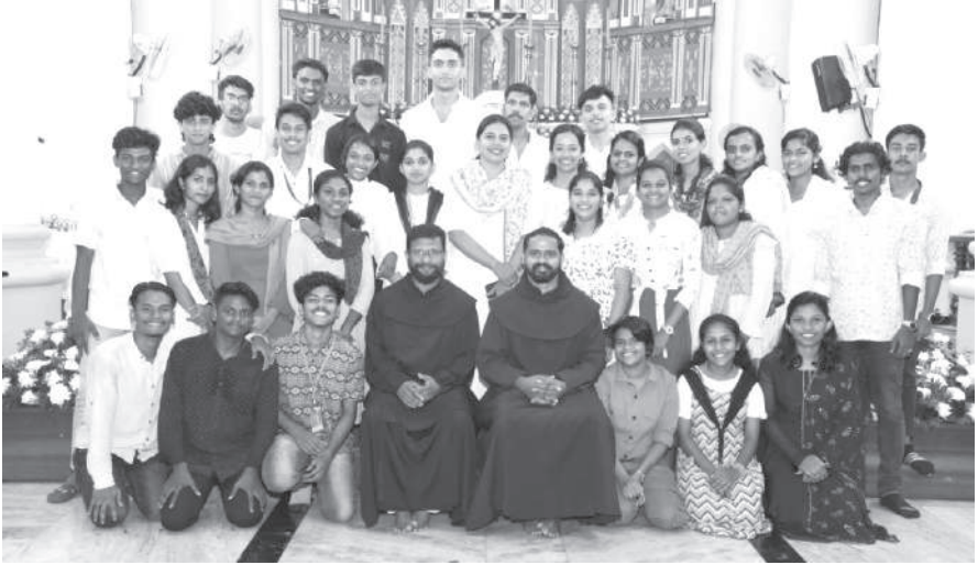
യുവജനങ്ങൾ വികാരിയച്ചനോടും കൊച്ചച്ചനോടുമൊപ്പം

തിരുനാളിനോടനുബന്ധിച്ച് ഡിസംബർ അഞ്ചാം തീയതി കാർമൽ യൂത്തിന്റെ നേതൃത്വത്തിൽ യുവജന ദിനമായി ആചരിച്ചു.