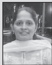
ബിഗ്ന ജെയ്സൺ സെന്റ് ആന്റണി എ ഫാമിലി യൂണിറ്റ്