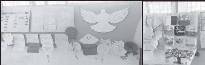
സെപ്റ്റംബർ മാസം 3-ാം തീയതി ഫാത്തിമ മാതാ മതബോധന വിഭാഗം നടത്തിയ ബൈബിൾ expo "biblia2023"