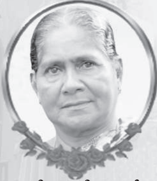
വിരോണി ലാസർ കൊല്ലംപറമ്പിൽ

അവിടുന്ന് എന്നെ ഏൽപ്പിച്ച ജോലി പൂർത്തിയാക്കിക്കൊണ്ട് ദുഃഖിയിൽ അവിടുത്തെ ഞാൻ മഹത്വപ്പെടുത്തി (യോഹ 16:6)