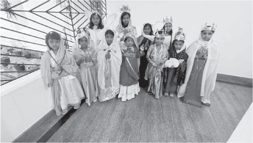
പരിശുദ്ധ അമ്മയുടെ വ്യത്യസ്ത വേഷങ്ങളുണിഞ്ഞ കുഞ്ഞുമക്കൾ

സഹകാർമികർ ആയിരുന്നു. ദിവ്യബലിയ്ക്ക് ശേഷം പ്രസുദേന്തിമാരായ കുട്ടികൾക്ക് വേണ്ടി പ്രത്യേക തൈലാഭിഷേക പ്രാർത്ഥന നടത്തുക യുമുണ്ടായി. പരിശുദ്ധ അമ്മയുടെ വ്യത്യസ്ത വേഷങ്ങളുണിഞ്ഞ കുഞ്ഞു മക്കൾ ദിവ്യബലിയിൽ പങ്കെടുത്തപ്പോൾ അത് കണ്ണിന് ആനന്ദം പകരുന്ന കാഴ്ചയായി.