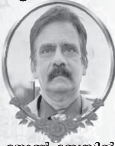
ജോൺ വേസിൽ തെക്കേവിള