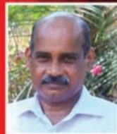
വിദ്യാഭ്യാസ ശുശ്രൂഷ കോ ഓർഡിനേറ്റർ ടോപ്സൺ അറയ്ക്കൽ